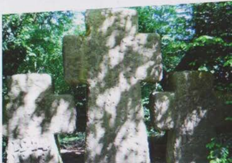
Kriegerdenkmal in Gockenholz